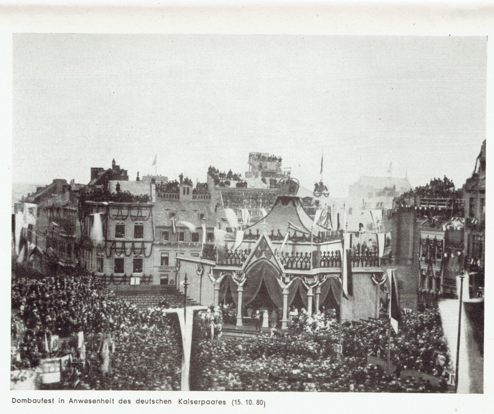
Dombaufest in Anwesenheit des deutschen Kaiserpaares (15. 10. 80)

Dombaufest in Anwesenheit des deutschen Kaiserpaares am 15. Oktober 1880