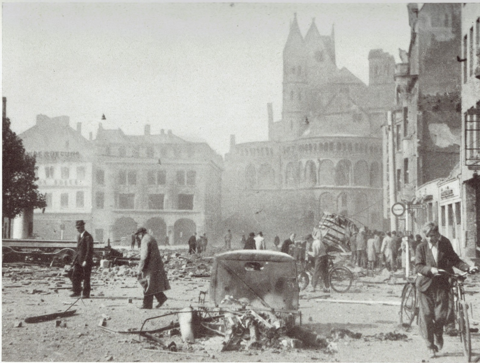
Nach dem ersten Tagesangriff