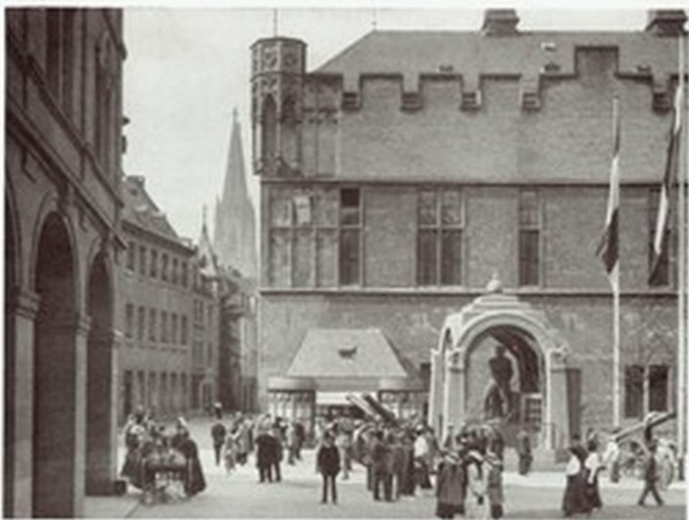
Der Görzenich mit dem altenen Bauer (1916)

Auch die Jugendarbeit an St.Paul und Maria-Hilf wurde mehr und mehr zum frohen Ausgleich für den erwachsen werdenden Jupp. Namenstage und Geburtstage wurden in den Familien und auch in der Jugendgruppe immer und gern zusammen gefeiert. Die Jugend radelte nun an jedem Wochenende raus aus der großen Stadt, hinaus ins Grüne, den schöne Rhein entlang in das Siebengebirge. Der große und entsetzliche Krieg hatte die jungen Gemüter wacherüttelt, als Wandervögel suchten sie nach neuen und ganz anderen Antworten. Und mit Willi Ostermann sang die Jugend: "Und sollt' ich im Leben ein Mäd'el mal frei'n, so muss es am Rhein nur geboren sein!"