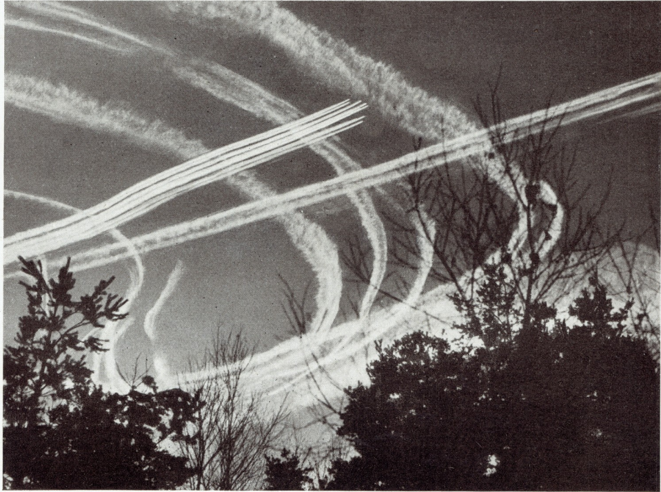
Flieger über Köln