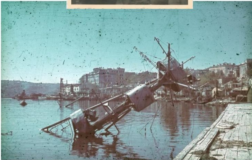
Bundesarchiv, N 1803 Bild-129 Foto: Grund, Horst | Juli 1942 ca.